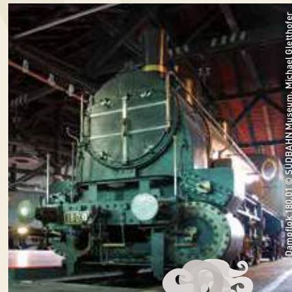
Dampflok 180.01

info@suedbahnmuseum.at • www.suedbahnmuseum.at