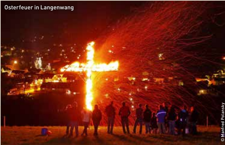
Osterfeuer in Langenwang