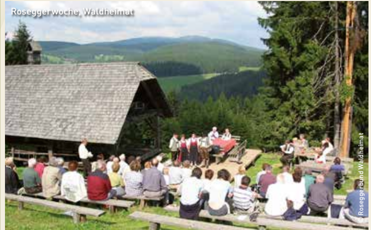
Rosegger woche, Waldheimat