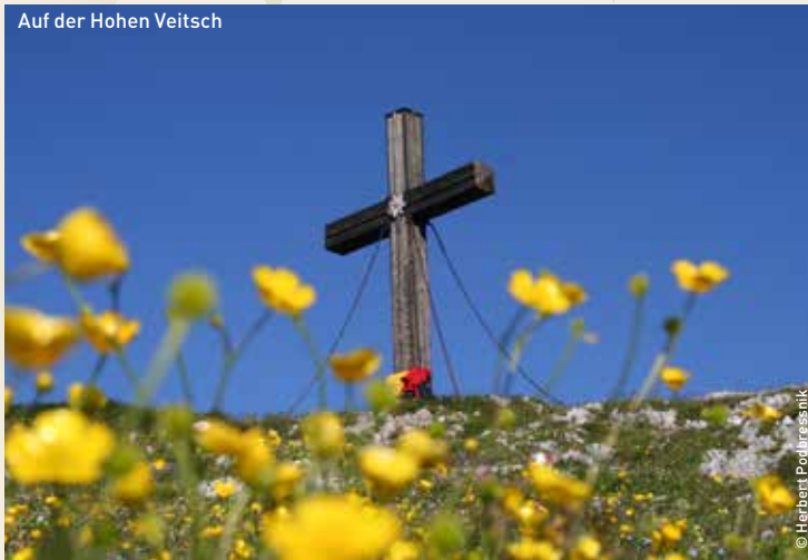
Auf der Hohen Veitsch

INFO und Anmeldung T: +43 (0)650 6217567