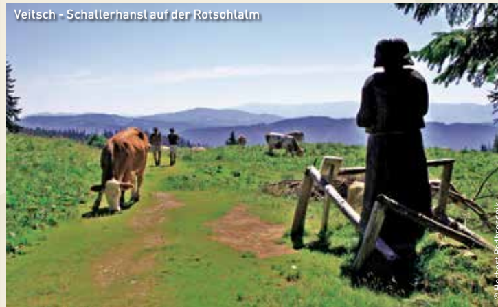
Veitsch - Schallerhansl auf der Rotschoalm

Detaillierte Beschreibungen unserer Touren inklusive Kartenmaterial finden Sie auch auf unserer Homepage www.semmering-waldheimat-veitsch.at unter der Rubrik » interaktiver Urlaubsplaner «.