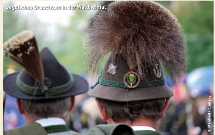
Jagdliches Brauchtum in der Waldheimat